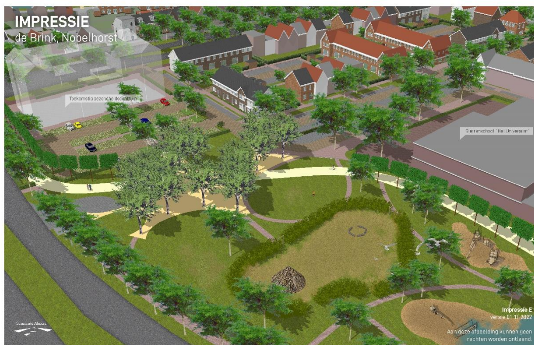
Afbeelding 2. Toekomstige situatie De Brink – met gezondheidscentrum, exclusief tijdelijke gebouwen